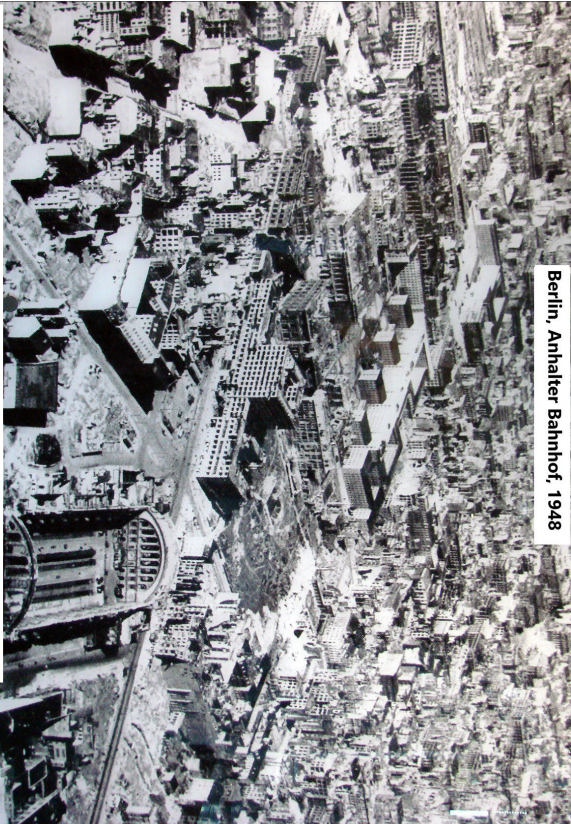
Berlin, Anhalter Bahnhof, 1948